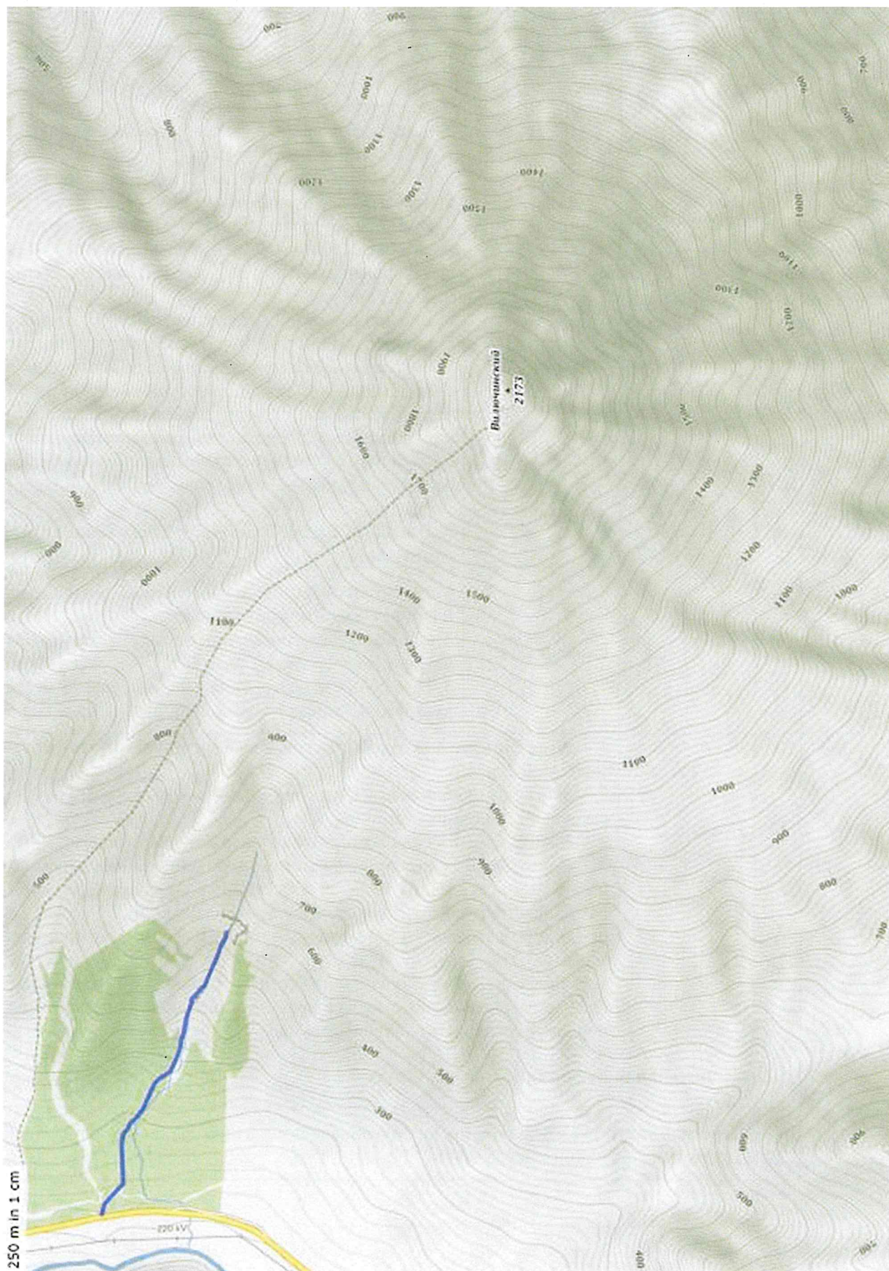
СХЕМА ТУРИСТСКОГО МАРШРУТА «ВОДОПАД ВИЛЮЧИНСКИЙ»