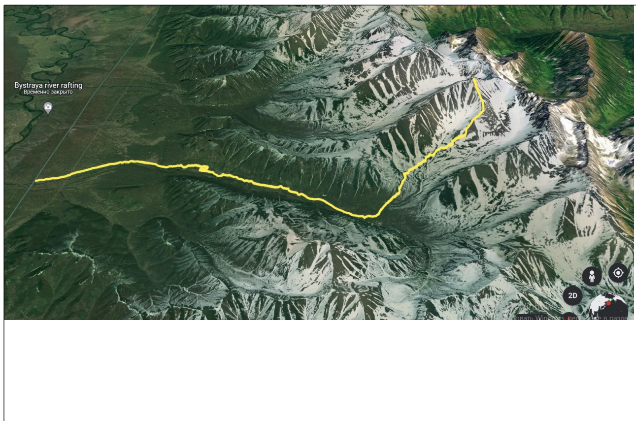
СХЕМА ТУРИСТСКОГО МАРШРУТА «ГОРА ЮРЧИК»